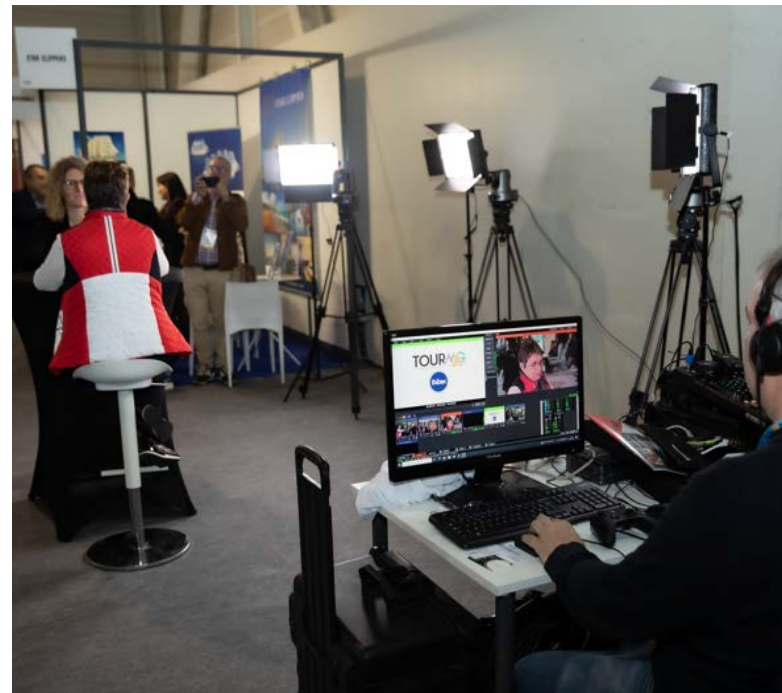
Exemple d'interview réalisée

Un grand plateau télé en plein coeur du salon, avec des interviews des exposants tout le long de la journée, organisé par TourMaG et visible sur Youtube