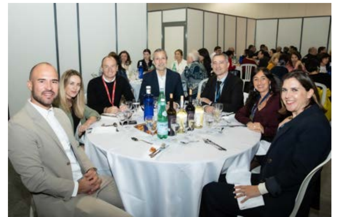
Quelques photos du Club Déjeuner lors du DiteX 2024