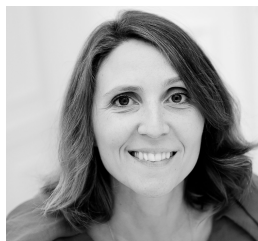
Promote Iceland c/o GroupExpression Virginie Le Norgant Director