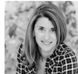
Promote Iceland c/o GroupExpression Laure Le Cornec Account PR & Marketing Manager